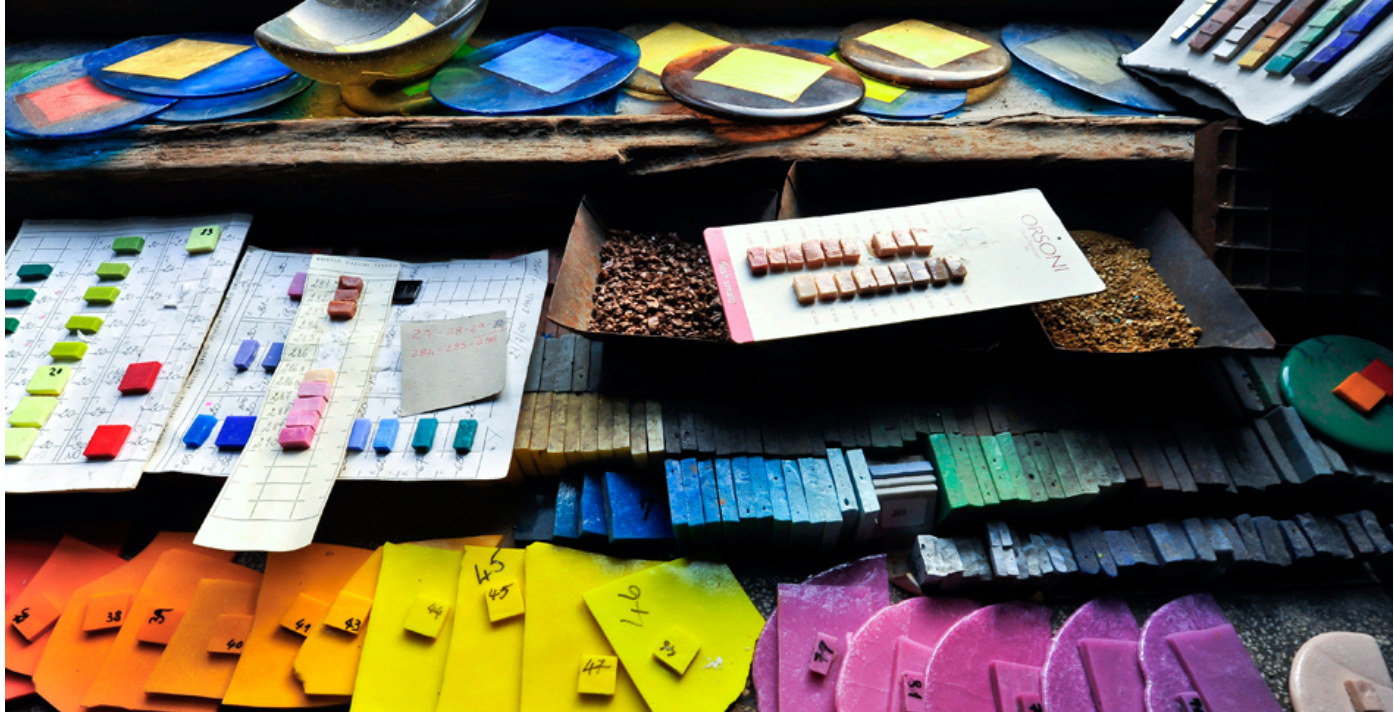
photo workshop Arti e Mestieri a Venezia 16 - 19 Aprile 2015

Continua evolvendosi di anno in anno uno dei Photo Workshop più entusiasmanti del nostro repertorio. In questa edizione Aprile 2015 abbiamo previsto ben 3 giornate di lavoro fotografico di ripresa e una giornata dedicata ad una sessione di revisione individuale delle immagini realizzate.